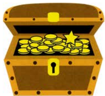
BBQ TREASURE HUNT