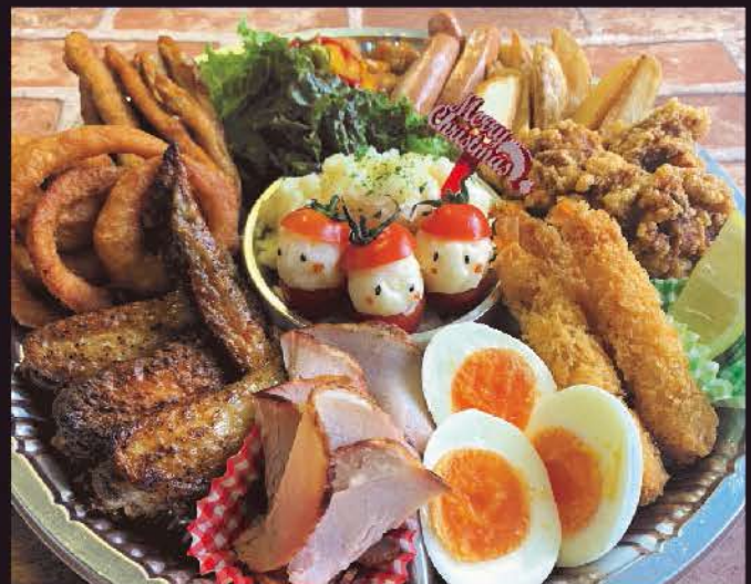
クリスマスオードブル (事前予約をおすすめ致します。)