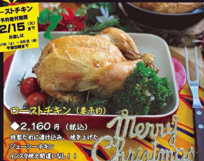
ローストチキン (要予約)

ローストチキン 予約受付期間 12/15 (火) まで お直しは 12/19 (土) ~ 26日 (金) 午後5時まで